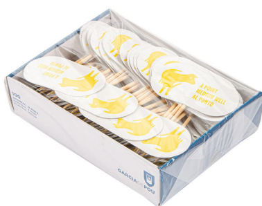
Image du paquet

Règlement (CE) n° 2023/2006 de la Commission du 22 décembre 2006 relatif aux bonnes pratiques de fabrication des matériaux et objets destinés à entrer en contact avec des denrées alimentaires.